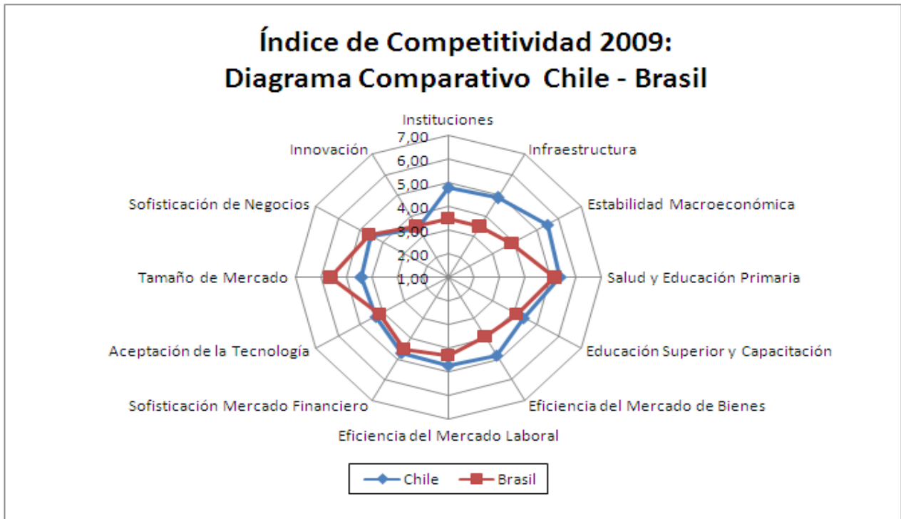
Gráfico N° 2 Chile y Brasil en el Índice de Competitividad 2009