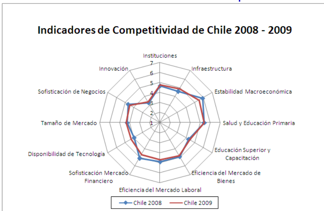
Gráfico N° 3 Evolución de los Indicadores de Competitividad